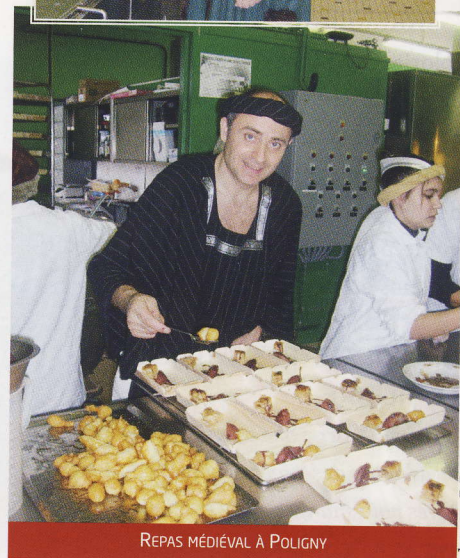
REPAS MÉDIÉVAL À POLIGNY