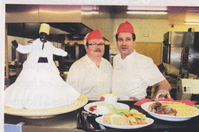
LA TURQUIE EN GIRONDE

Le Nouvel An chinois les inspire également. Le collège Alfred Mauguin à Gradiignan a ainsi proposé un repas chinois composé de nems, salade de soja au surimi, sauté de canard au caramel et épices, riz cantonais et beignet ananas. Dans le Jura, au collège Jules Grévy de Poligny, les cuisines du monde ont aussi été à l'honneur avec notamment un menu mexicain et un autre pour la Saint Patrick. En janvier dernier, une animation de grande ampleur a été entreprise autour d'un repas