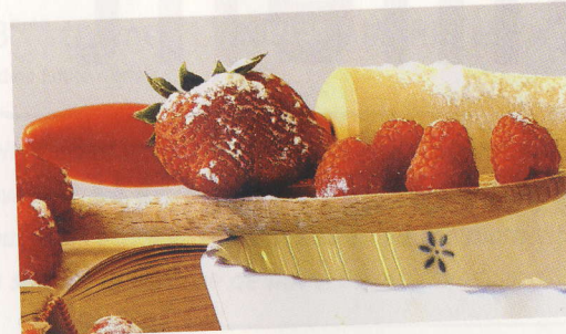
Fabrice Malburet, Valence