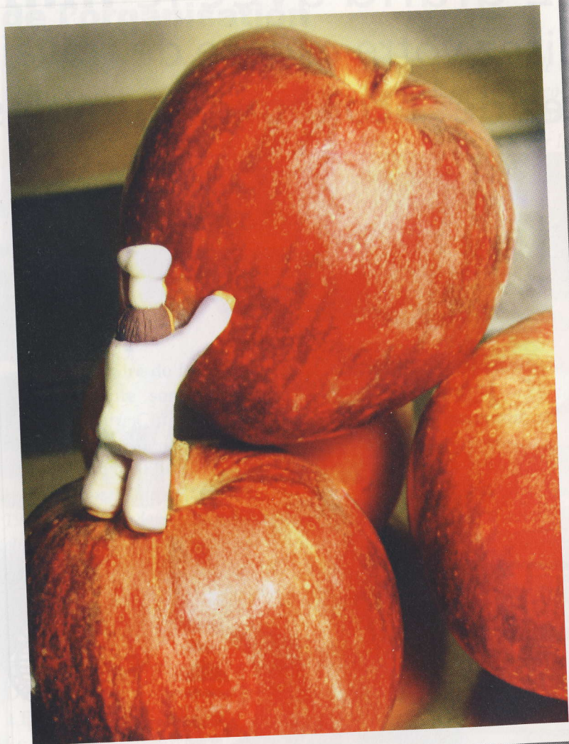
Notre coup de coeur !