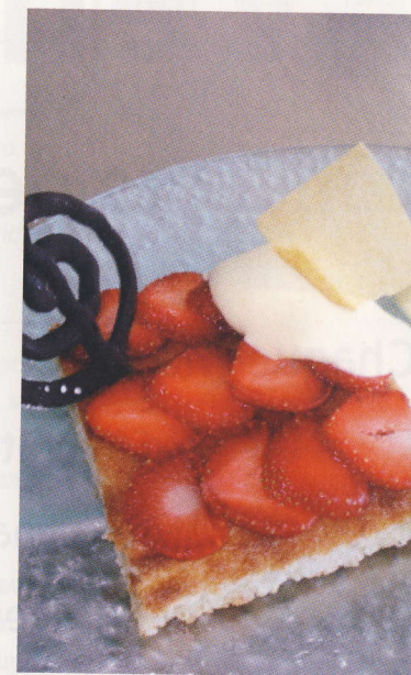
Franck Pouffet, Mérignac